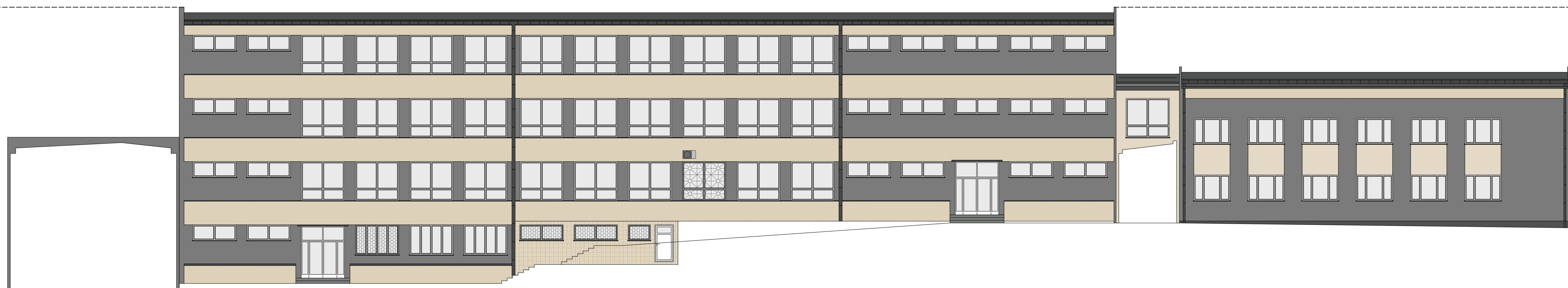
ELEWACJA WSCHODNIA ( od dziedzińca)