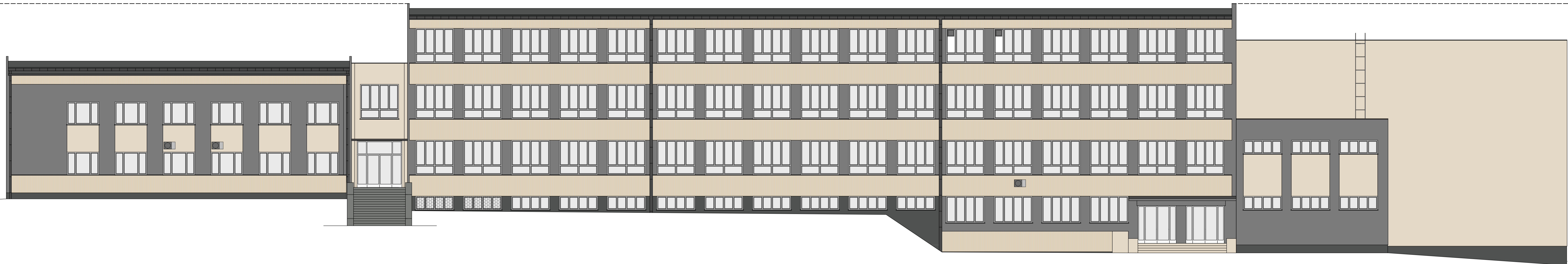
ELEWACJA ZACHODNIA - FRONTOWA ( od ul. Harcerskiej)